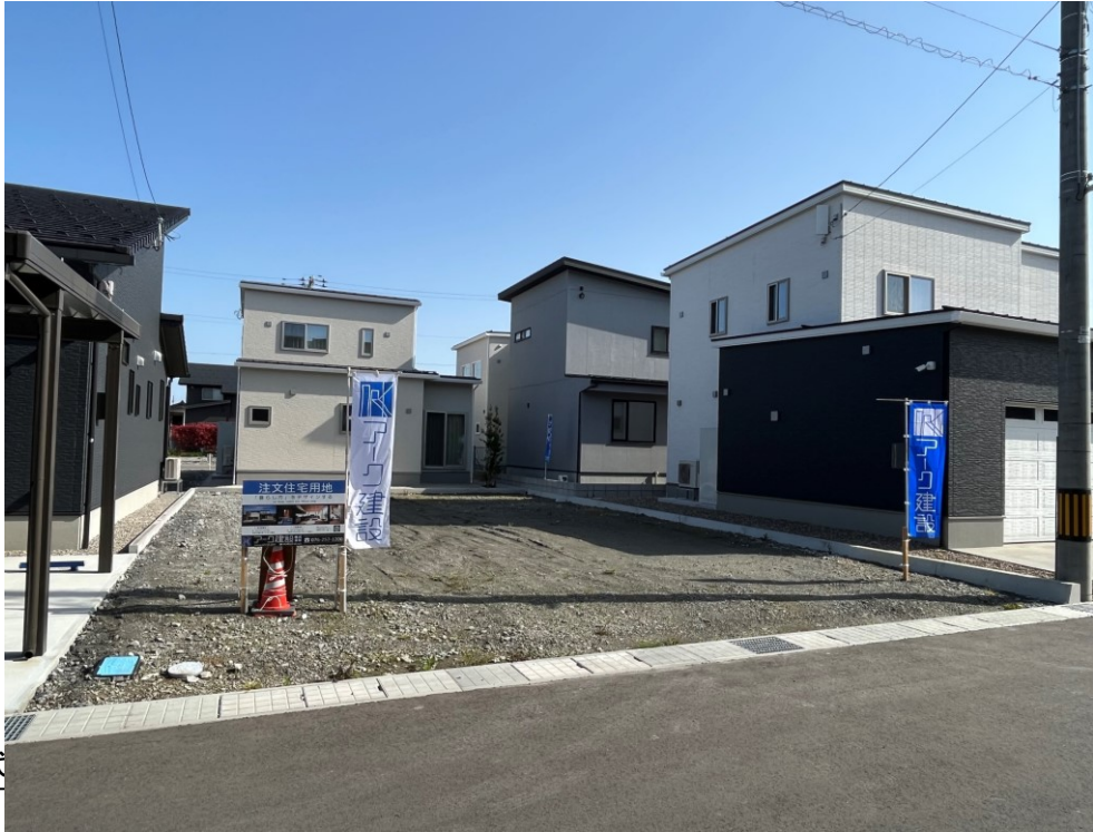
< 写真 >