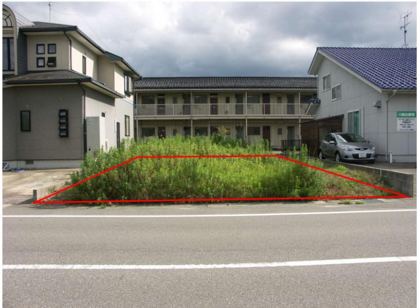
< 写真 >