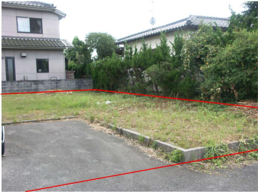
< 写真 >