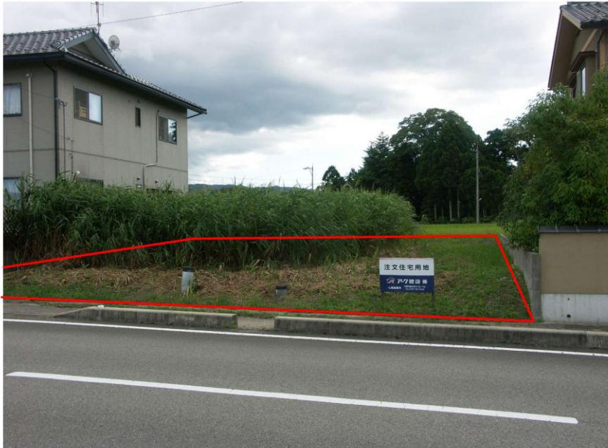
< 写真 >