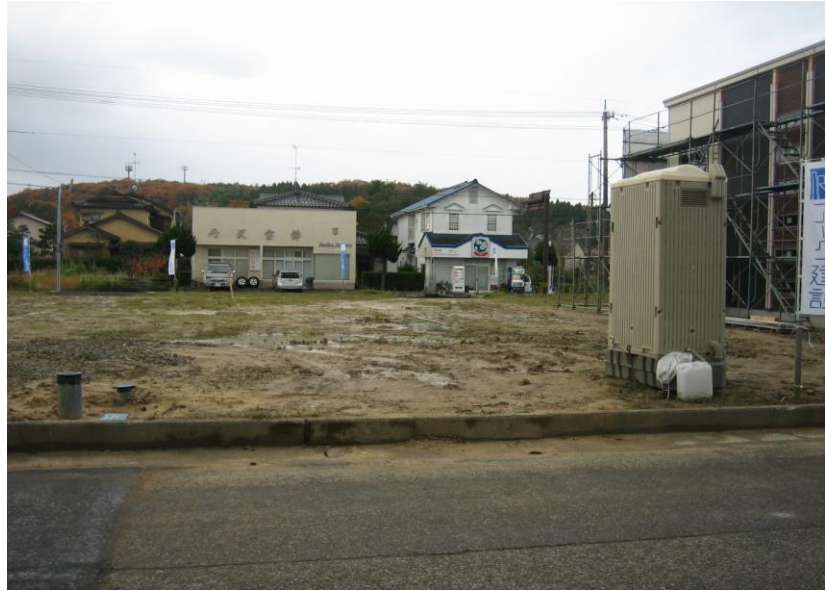
< 写真 >