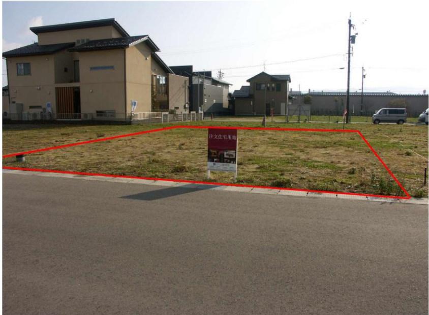
< 写真 >