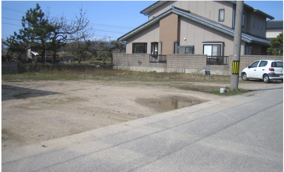
《 現地写真 》